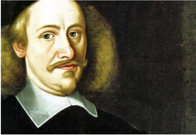
Ein Leben für Magdeburg