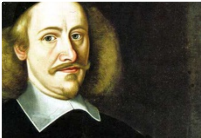
Otto von Guericke