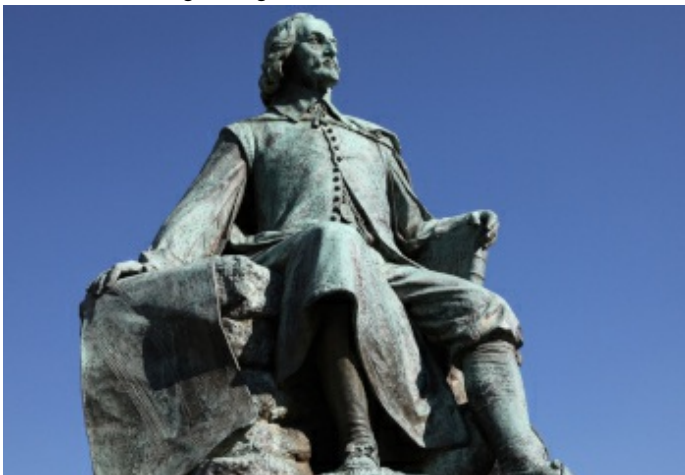
Neue Magdeburger Experimente