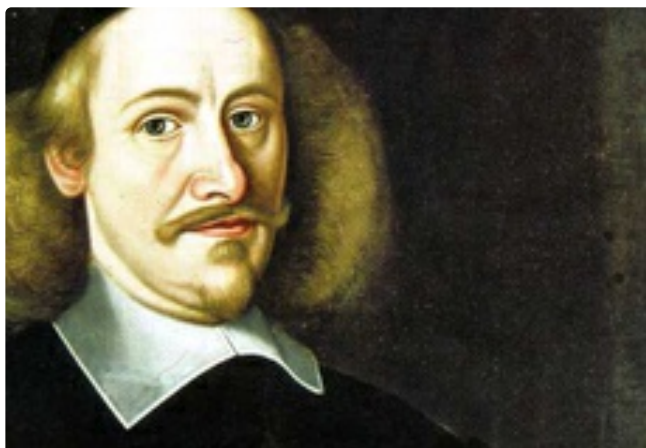
Otto von Guericke